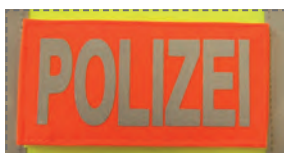
DETAILANSICHT Klettaufschrift „POLIZEI“

Auch wurde beachtet, dass die Funktion eines Halsbandes oder Brustgeschirrs unbeeinflusst bleibt. Der Halsbereich ist frei. Im Rückenbereich befindet sich eine Öffnung, durch die der Griff des Geschirrs, wie auch der Ring zum Fixieren der Leine genutzt werden kann.